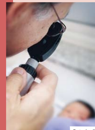
Teste do olhinho

Sempre em busca de novas tecnologias que beneficiem seus pacientes, o Hospital Santa Catarina oferece, com exclusividade, um exame oftalmológico preventivo de alta precisão. O procedimento é realizado com o RetCam, aparelho que fotografa a retina do bebê em alta resolução. O registro fotográfico é feito na maternidade e o resultado entregue à família até a alta do bebê. Disponível inicialmente para o berçário, o exame inclui estudo de alta precisão, diagnóstico e análise especializada.