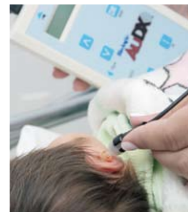
Teste da orelhinha